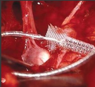
Imagen 1. Colocación IATC

LUGAR DE APLICACIÓN Instituto Superior de Otorrinolaringología, Centro de Implantes Cocleares Profesor Diamante. Buenos Aires, Argentina.